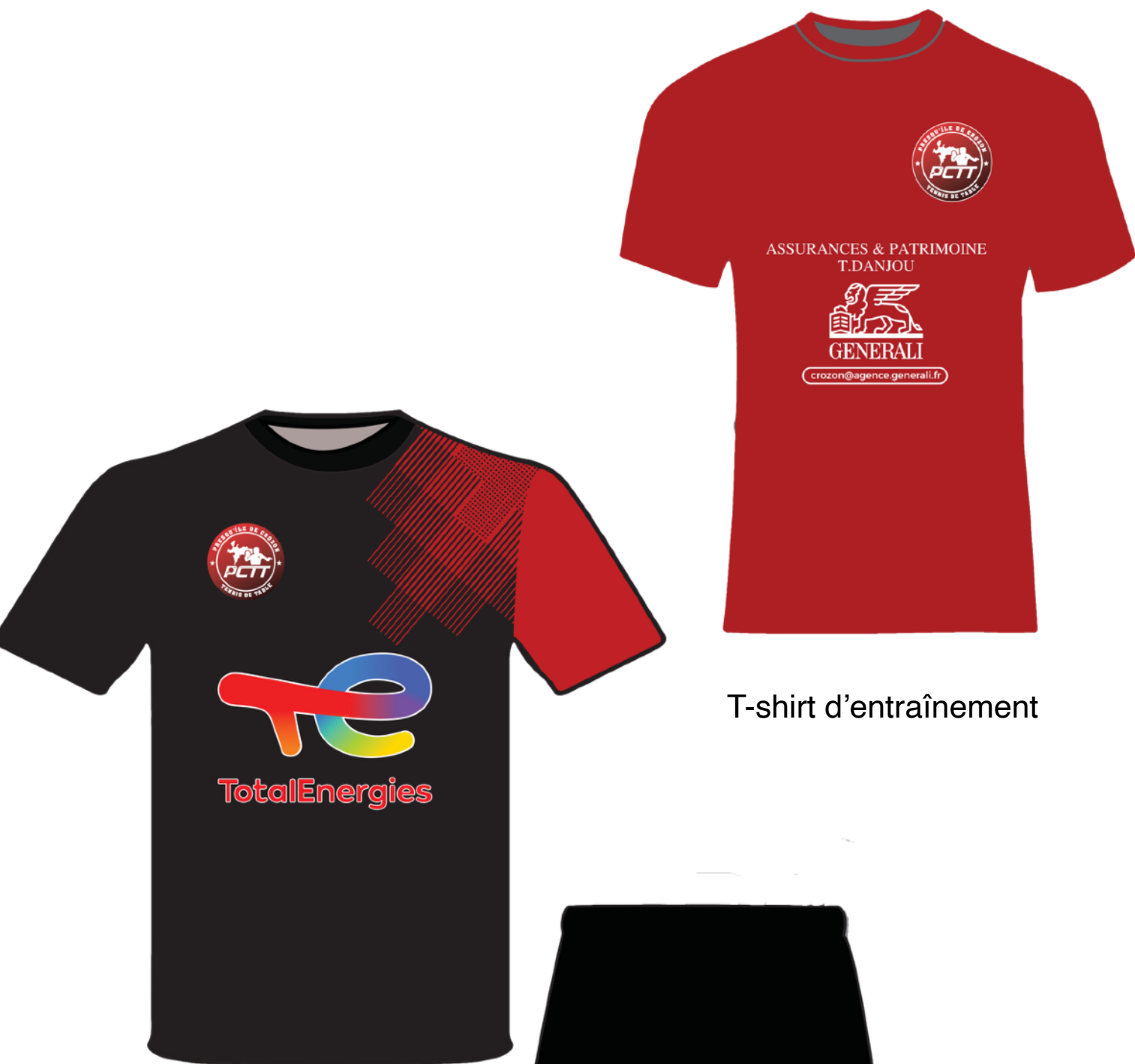
Tenue des compétiteurs