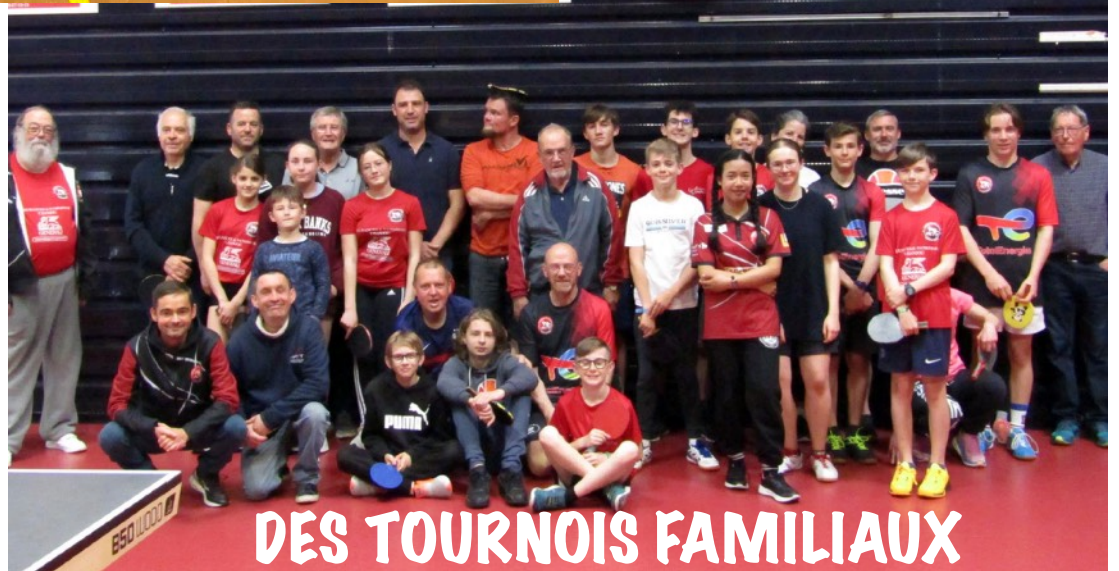
DES TOURNOIS FAMILIAUX